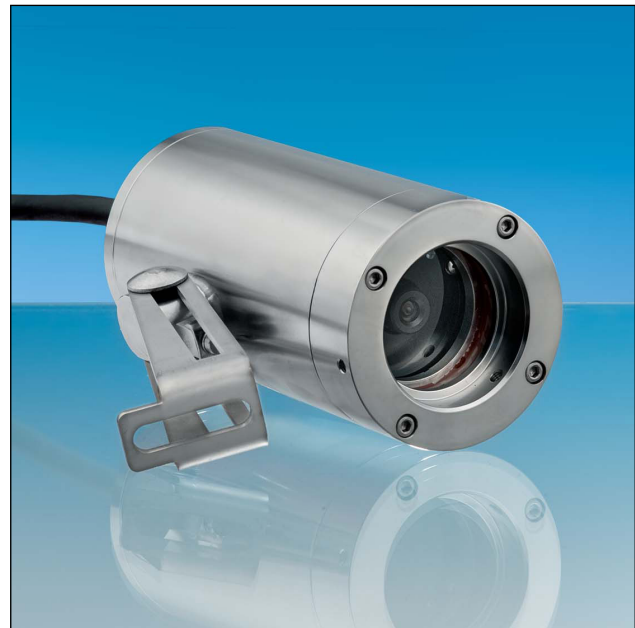
VISULEX Kamera K55-P mit Festobjektiv

Ein eventueller Austausch der Kamerabaugruppe erfolgt ausschließlich durch den Hersteller bzw. im Werk des Herstellers (F.H. Papenmeier GmbH & Co. KG).