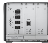
1fach Kamera-Rack mit Videoserver