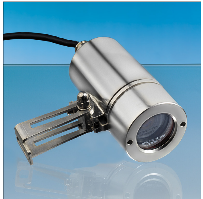
VISULEX Ex-Kamera K25ZP-Ex mit Zoom-Objektiv