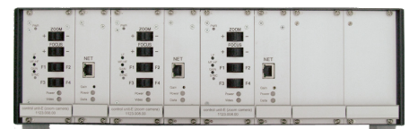
6fach Kamera-Rack mit drei Kamera-Einschüben und drei Videoservern bestückt