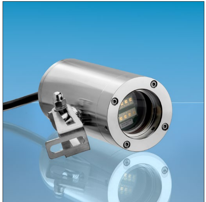
Lumiglas Meldegerät M55-BD-Ex