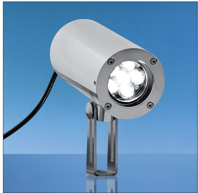
Lumistar Leuchte ESL55LED-Ex