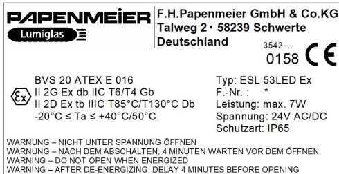
Abbildung 1 Typenschild