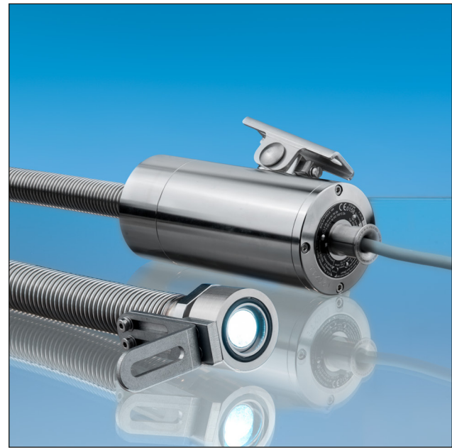
Lumistar Leuchte 'Lumiflex' ESL55LED-ALF-Ex

Die Ex-Leuchten werden mit einer dauerhaft verbundenen Leitung hergestellt. Die freien Enden der Anschlussleitung müssen in einem Gehäuse der Kategorie 2G/2D installiert werden, wenn der Anschluss im explosionsgefährdeten Bereich erfolgt. Vor der Installation oder bei der Instandsetzung der Leuchte ist die Leuchte und der Bereich, an dem sie installiert werden soll, von Staub zu reinigen. Die demontierten Teile sind während der Installation oder Instandsetzung vor Verunreinigungen zu schützen. Beim Verschließen der Leuchte ist im hohen Maße darauf zu achten, dass das Innere der Leuchte frei von Staub ist. Die Anschlussleitung muss bei Einsatz in staubexplosionsgefährdeten Bereichen vor elektrostatischen Aufladungen geschützt verlegt werden.